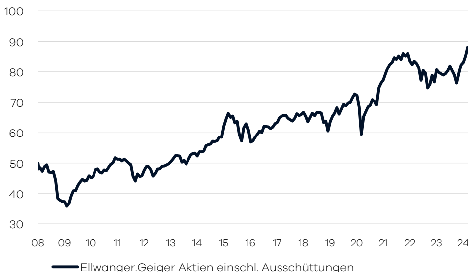
Bruttowertentwicklung 1 seit Auflage

Die internationale Aufteilung im Fonds wird durch die volkswirtschaftliche Analyse der Bankhaus Ellwanger & Geiger AG festgelegt. Passiv gemanagte Fonds (ETFs) über verschiedene Indizes hinweg bilden das Grundgerüst der Portfolio-Allokation. Ergänzend wird in aktiv gemanagte Aktienfonds investiert, welche bestimmte Länder/Regionen oder Themen/Branchen abdecken. Die Auswahl dieser Drittfonds erfolgt auf Basis eines unabhängigen, quantitativen und qualitativen Screenings. Der Fonds eignet sich für Aktienanleger mit einem langfristigen Anlagehorizont von mindestens 10 Jahren.