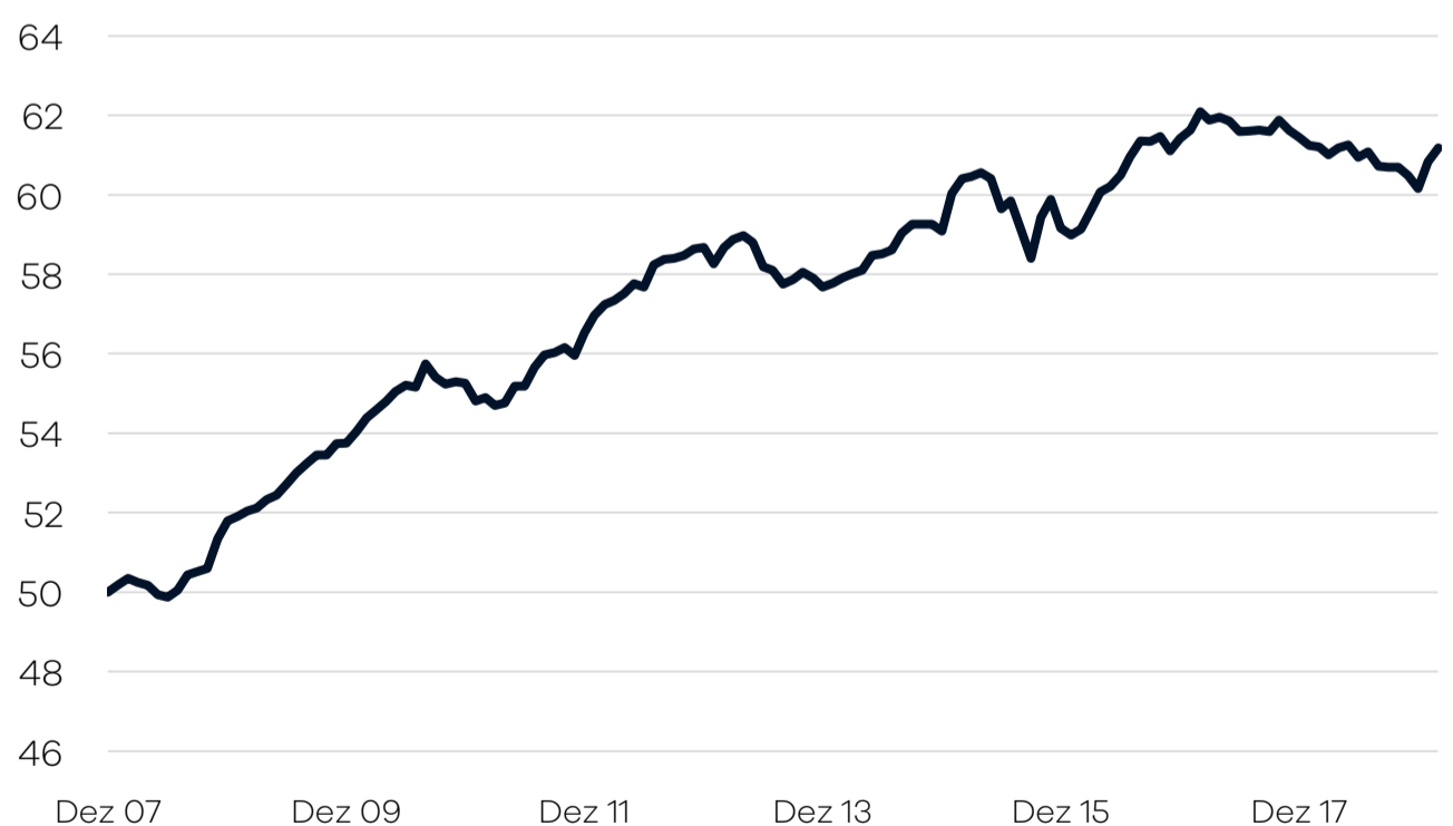
Bruttowertentwicklung 1 seit Auflage

— Ellwanger.Geiger Anleihen einschl. Ausschüttungen