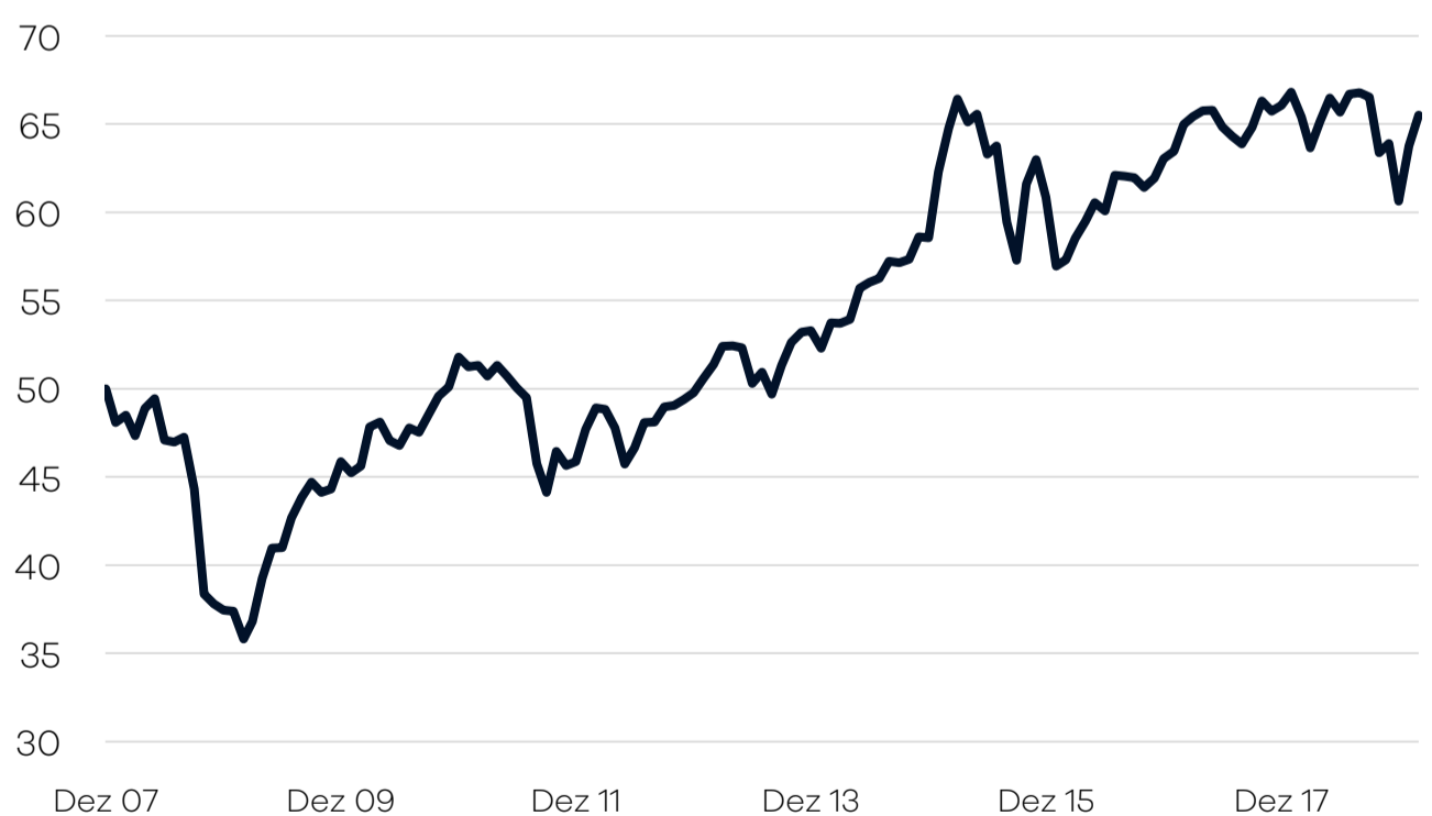
Bruttowertentwicklung 1 seit Auflage

— Ellwanger.Geiger Aktien einschl. Ausschüttungen