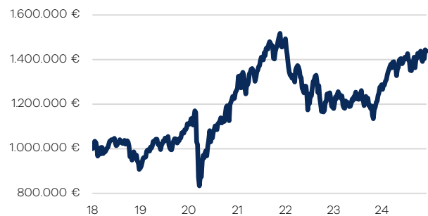
einer Investition von 1.000.000 Euro am 01.01.2018