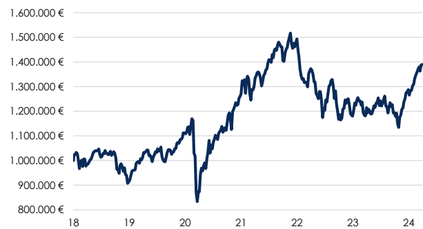
einer Investition von 1.000.000 Euro am 01.01.2018