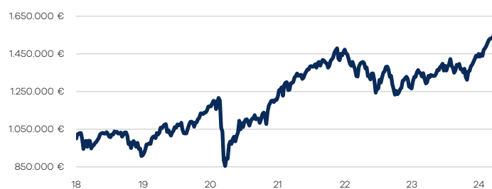
einer Investition von 1.000.000 Euro am 01.01.2018