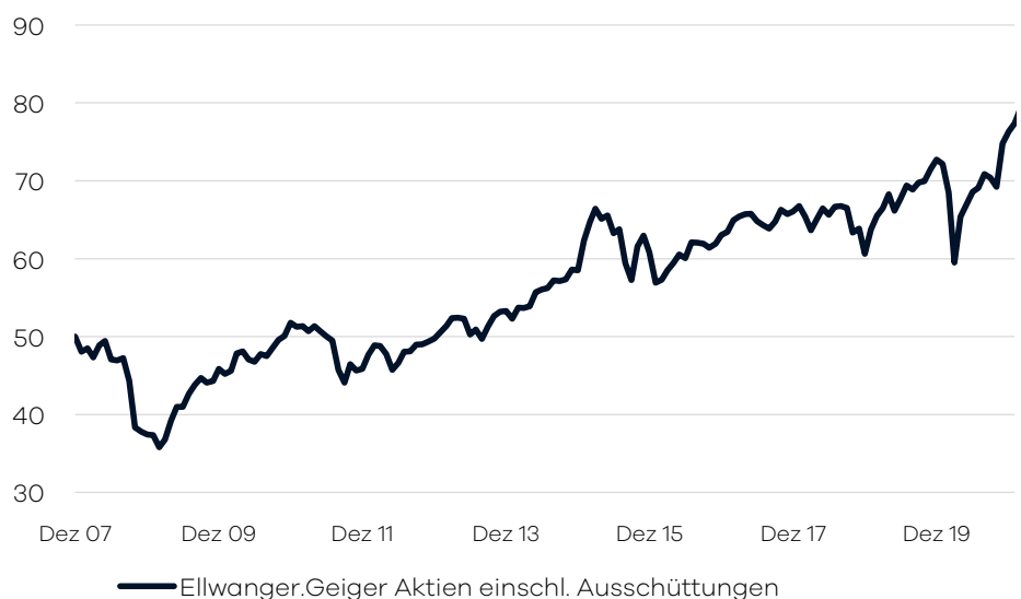
Bruttowertentwicklung 1 seit Auflage

Die internationale Aufteilung im Fonds wird durch die volkswirtschaftliche Analyse der Bankhaus Ellwanger & Geiger AG festgelegt. Passiv gemanagte Fonds (ETFs) über verschiedene Indizes hinweg bilden das Grundgerüst der Portfolio-Allokation. Ergänzend wird in aktiv gemanagte Aktienfonds investiert, welche bestimmte Länder/Regionen oder Themen/Branchen abdecken. Die Auswahl dieser Drittfonds erfolgt auf Basis eines unabhängigen, quantitativen und qualitativen Screenings. Der Fonds eignet sich für Aktienanleger mit einem langfristigen Anlagehorizont von mindestens 10 Jahren.