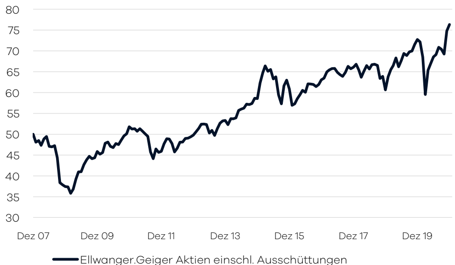
Bruttowertentwicklung 1 seit Auflage

Die internationale Aufteilung im Fonds wird durch die volkswirtschaftliche Analyse der Bankhaus Ellwanger & Geiger AG festgelegt. Passiv gemanagte Fonds (ETFs) uber verschiedene Indizes hinweg bilden das Grundgerust der Portfolio-Allokation. Erganzend wird in aktiv gemanagte Aktienfonds investiert, welche bestimmte Lander/Regionen oder Themen/Branchen abdecken. Die Auswahl dieser Drittfonds erfolgt auf Basis eines unabhangigen, quantitativen und qualitativen Screenings. Der Fonds eignet sich fur Aktienanleger mit einem langfristigen Anlagehorizont von mindestens 10 Jahren.