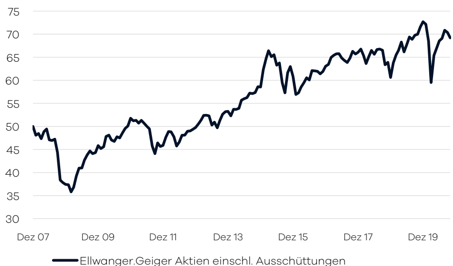
Bruttowertentwicklung 1 seit Auflage

Die internationale Aufteilung im Fonds wird durch die volkswirtschaftliche Analyse der Bankhaus Ellwanger & Geiger AG festgelegt. Passiv gemanagte Fonds (ETFs) uber verschiedene Indizes hinweg bilden das Grundgerust der Portfolio-Allokation. Erganzend wird in aktiv gemanagte Aktienfonds investiert, welche bestimmte Lander/Regionen oder Themen/Branchen abdecken. Die Auswahl dieser Drittfonds erfolgt auf Basis eines unabhangigen, quantitativen und qualitativen Screenings. Der Fonds eignet sich fur Aktienanleger mit einem langfristigen Anlagehorizont von mindestens 10 Jahren.